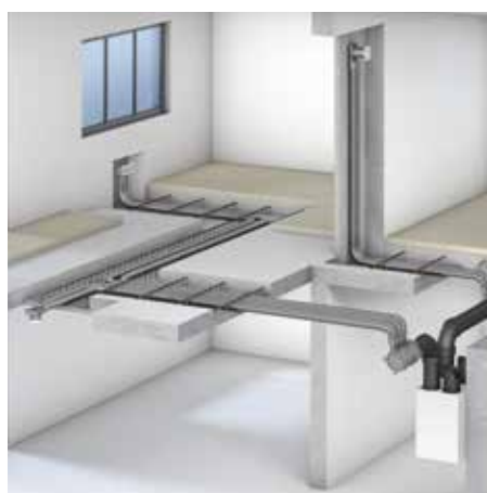
Makkelijke plaatsing in de dekvloer

Gezien het geringe aantal verschillende componenten hoeft de installateur geen complex voorraadbeheer te voeren. De kleine toebehoren die nodig zijn bij de installatie, zoals afdichtingen, verbindingstukken en andere kleine onderdelen, worden systematisch met de componenten van het systeem meegeleverd.