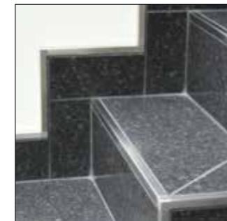
Traprand en sokkelrand

Schlüter®-QUADEC is een afsluitprofiel voor buitenhoeken van tegelbekledingen en sokkeltegels. Dit product is in verschillende materialen, kleuren en oppervlakken verkrijgbaar, waardoor de buitenhoek van de bekleding qua kleur perfect op de kleuren van de tegels en de voegen kan worden afgestemd of waardoor interessante accenten kunnen worden gelegd. De uitvoering in roestvast staal kan ook als vloerafsluiting of traprand worden gebruikt. Zo kunnen ook afsluitingen, hoeken of sokkelbedekkingen van een ander materiaal zoals tapijt of parket worden gerealiseerd.